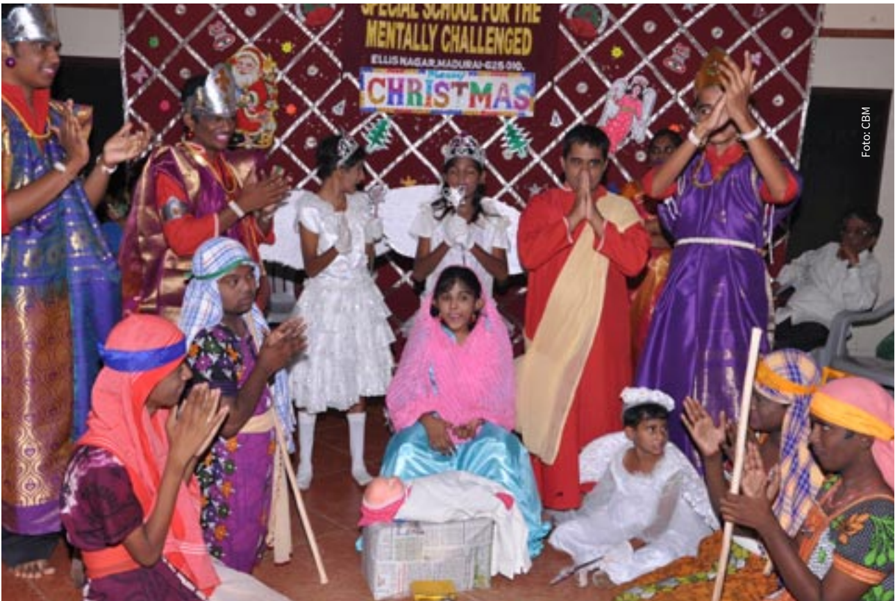
↑ Weihnachtsfeier in einem CBM-geförderten Projekt in Indien.