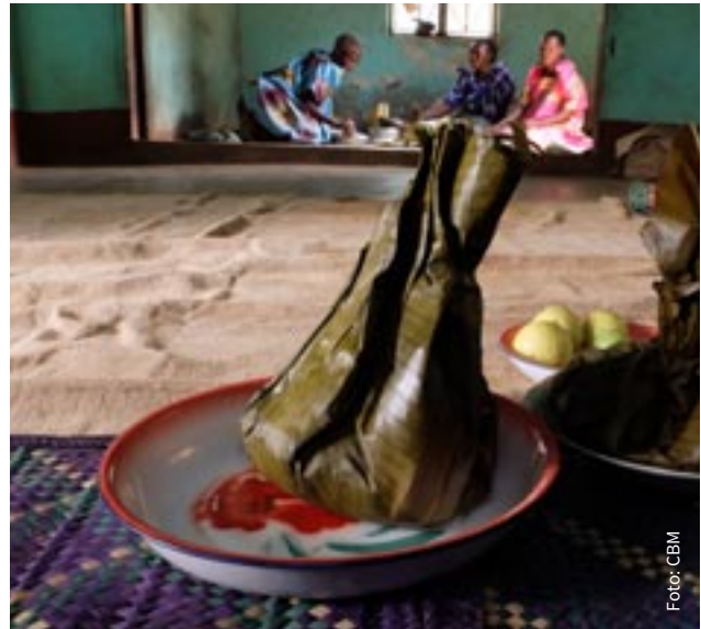
↑ Traditionelle Delikatesse in Uganda: Luwombo – im Bananblatt gedünstetes Hühner- oder Rindfleisch.

Fleisch zartkochen, Brühe aufbewahren. Öl in einer Pfanne erhitzen, die Zwiebel darin goldbraun anbraten. Fleisch dazugeben, anbraten (falls nicht vorgekocht, gut durchbraten), salzen. Knoblauch, Pilau Masala, Zucker und Tomatenmark hinzufügen, zwei Minuten umrühren.