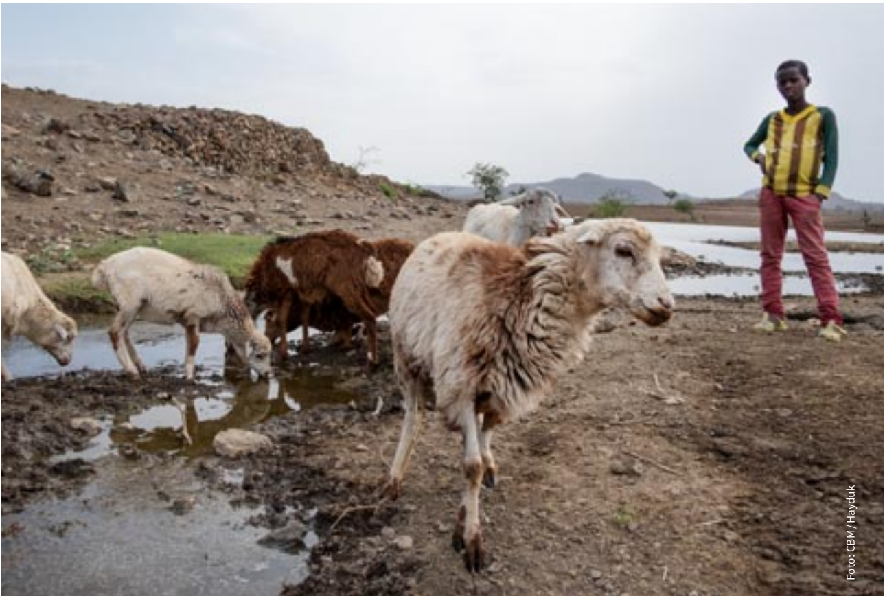
↑ Dürre in Äthiopien: Schafe finden Wasser an einem Damm, der vom CBM-Projektpartner ORDA repariert wurde.

ten aufgrund ihrer Arbeit die geltenden jüdischen Reinheitsvorschriften nicht einhalten können, sind sie oftmals von Synagogengottesdienst und Tempelbesuch ausgeschlossen. Durch die Verkündigung der Frohen Botschaft an die Hirten und die Einladung, das Neugeborene zu besuchen, werden die Hirten gewürdigt und in die Gemeinschaft Gottes eingeladen.